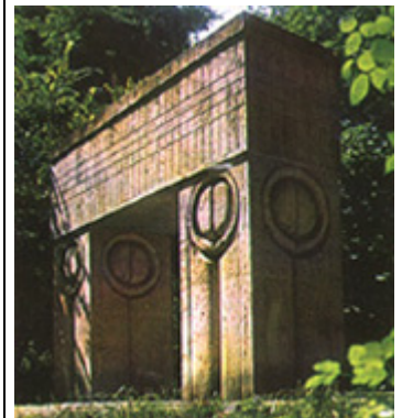
"O Portão do Beijo"