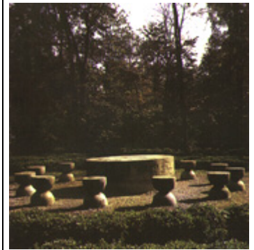
"A Mesa do Silêncio"

Abraçando a França como sua segunda pátria, Brâncusi morreu em Paris, em 16 de março de 1957.