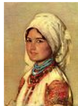
Camponesa de Muscel